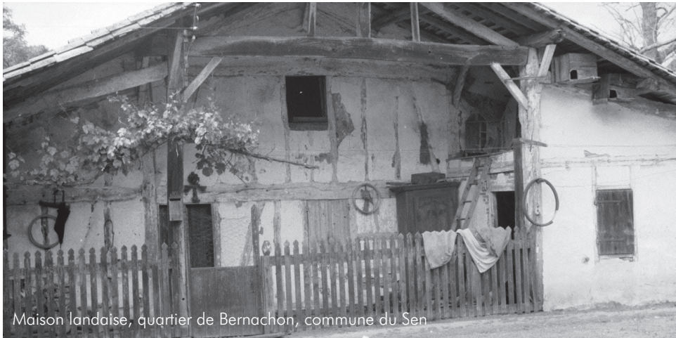
Maison landaise, quartier de Bernachon, commune du Sen

De 1939 à 1984, Claudie Marcel-Dubois et Maguy Pichonnet-Andral, deux chercheuses regardées comme les fondatrices de l'ethnomusicologie du domaine français, ont sillonné la France rurale et les Outre-mer pour enquêter sur les pratiques musicales et chantantes, la fabrication des instruments de musique populaire et le rôle des phénomènes sonores d'origine humaine dans les manifestations festives.