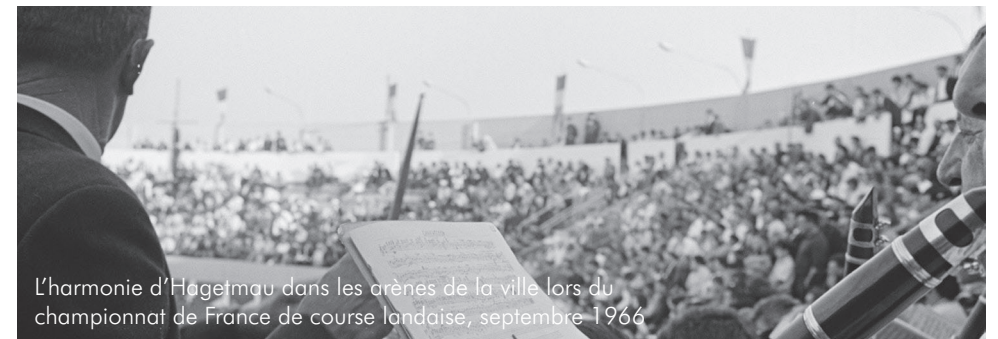
L'harmonie d'Hagetmau dans les arènes de la ville lors du championnat de France de course landaise, septembre 1966